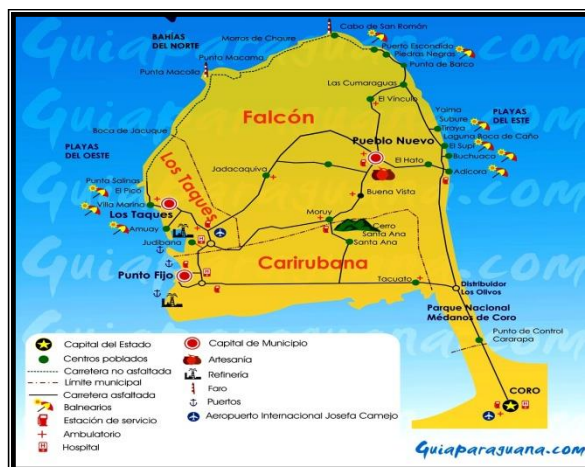
Gráfico 1. Mapa Turístico de la Península de Paraguana. Elaborado por Fonseca (2018)

Nota. Elaboración Propia con el resultado de las encuestas aplicadas a la comunidad de Punta Cardón (2018).